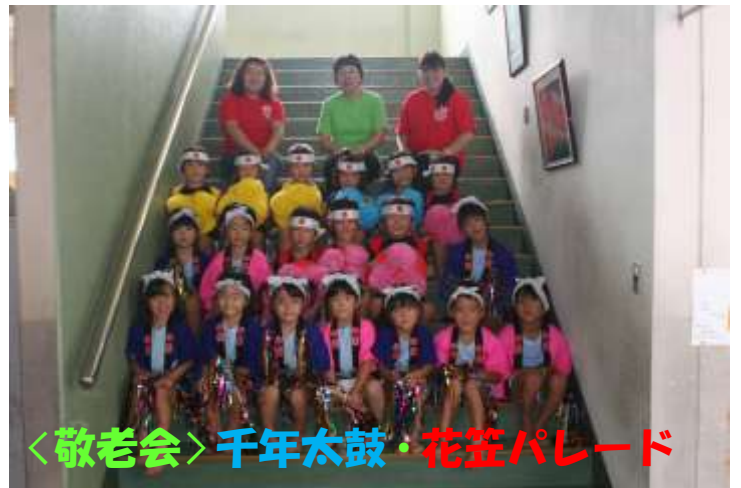
<敬老会> 千年太鼓・花笠パレード