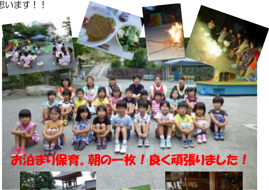
お泊まり保育。朝の一枚！良く頑張りました！